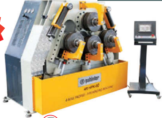
4R HPK 90