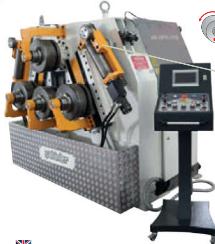
4R HPK 110