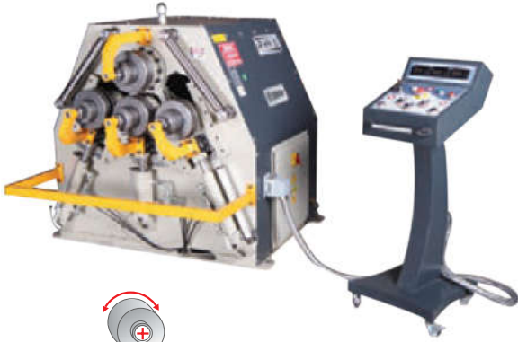
4R HPK 70

4-х валковый гидравлический станок для гибки профиля и труб